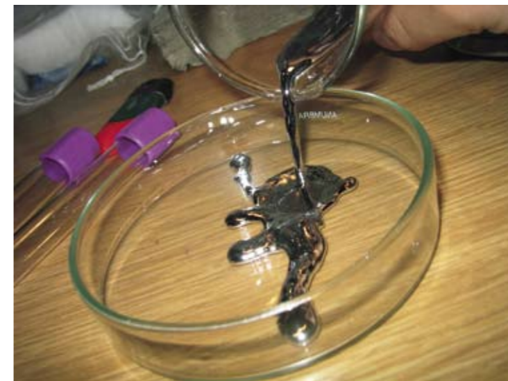
Im Beispielfall wurde Mercurius u.a. verordnet wegen der Prostata Entzündung, sehr starker stechender Schmerzen und der Verzweiflung, die zu Selbstmordgedanken führte.

Schwierigkeiten ergeben sich, wenn eine Symptomenarmut besteht, es sich also um eine einseitige Erkrankung handelt. Oft scheint dies der Fall zu sein;