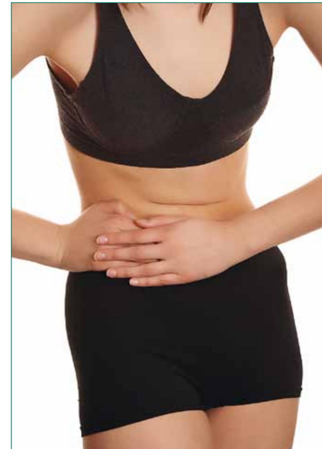
Nicht unerheblich sind auch die abdominalen Beschwerden der Patientin: Krampfartige Schmerzen nach dem Essen und wässrige Durchfälle.

Die Patientin war inzwischen glücklich verheiratet und Mutter einer kleinen gesunden Tochter. Sie schrieb ferner, dass sie seit 2007 immer wieder unter angeschwollenen Fußgelenken litt. Anfang 2008 wurde sie dann schwanger, erlitt aber in der neunten Woche eine Fehlgeburt. Es folgten zunehmend Verdauungsprobleme: Verstopfung und Durchfälle wechselten sich ab. Während der darauf folgenden zweiten Schwangerschaft bekam sie einen großen Analabszess, der den Durchmesser von 7 bis 8 cm hatte. Anfangs wurde wegen der Schwangerschaft gewartet, es entwickelte sich jedoch eine Sepsis, worauf der Abszess zweimal hintereinander operiert werden musste. Nach der überstandenen Operation schwellen wieder massiv die Gelenke von Knöchel, Knie, Finger und