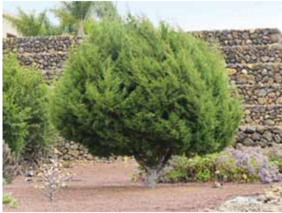
Ein weiteres Arzneimittel bei sykotischen Erkrankungen: Juniperus sabina, Sadebaum, aus der Familie der Zypressengewächse, eng verwandt mit Thuja occidentalis. Wirkung auf den Uterus, Abortneigung, Wirkung auf die serösen und fibrösen Membranen, Gicht, Kondylome.

Ellbogen an. Die gesamte Muskulatur schmerzte. Kurz vor der Geburt des Kindes, das Anfang 2009 mit Kaiserschnitt zur Welt kam, wurden die Gelenksbeschwerden besser. Der frühere Abszess meldete sich nur nach vermehrten Durchfällen. Wir verabredeten einen längeren Telefontermin, da die Patientin erst im Sommer einen Familienbesuch in Deutschland geplant hatte.