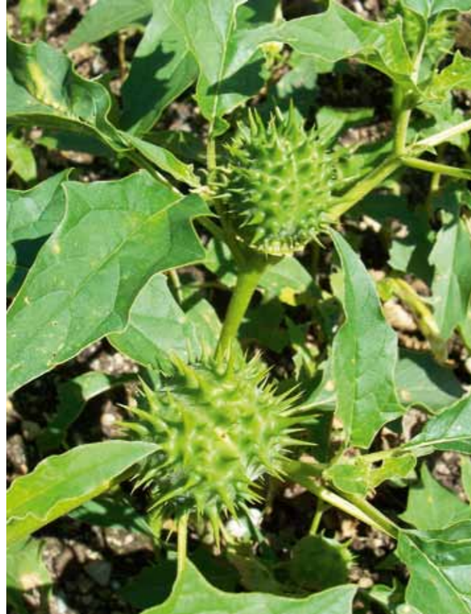
Mittelweisend für Stramonium ist die Gewalttätigkeit mit deutlicher Aggressivität, Zerstörungsneigung und Geschwätzigkeit.