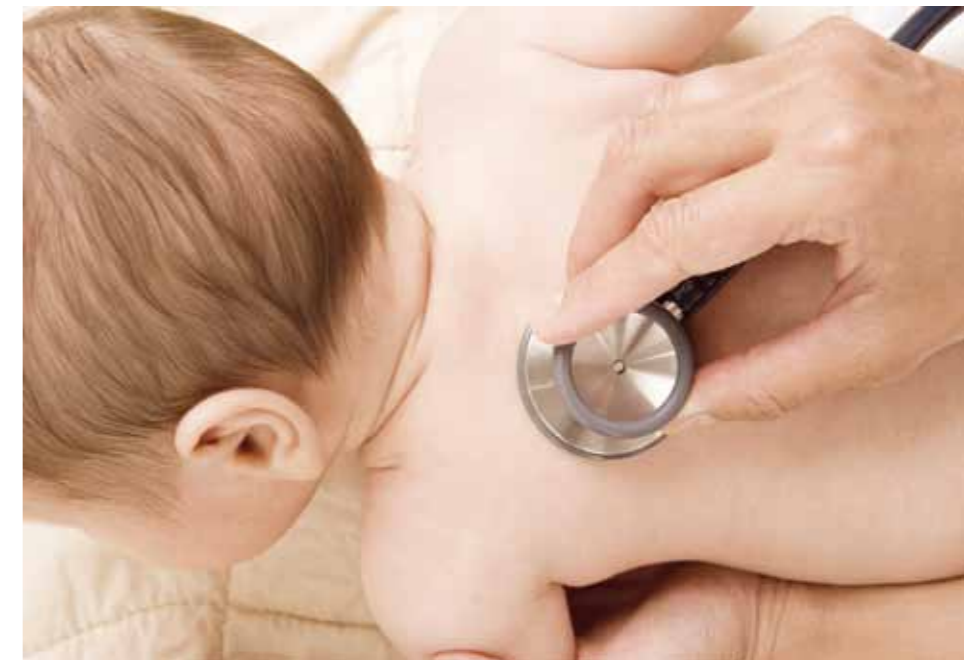
Eine möglichst genaue Diagnose mit Hinweis auf eventuellen Seitenbezug kann helfen, die in Frage kommenden Mittel zu differenzieren. So hat Natrium-Sulfuricum beispielsweise einen Bezug zum linken unteren Lungenlappen.

Wichtig ist halt, dass man diesen Ablauf nicht automatisch als Erstverschlimmerung betrachtet und