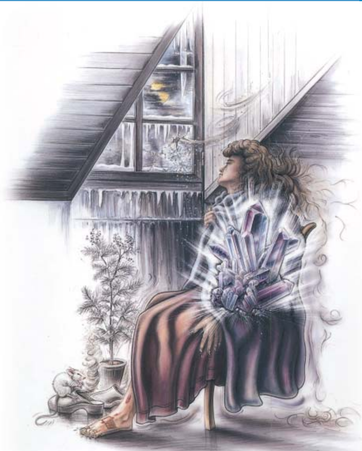
Abb. 42 Silicea-Persönlichkeit: graziler Körperbau, blasser Teint, hell durchscheinende Haut, dünne, spröde Haare, weiße Flecken auf den Fingernägeln, sanftmütig, friedfertig, gewissenhaft aber unflexibel, lässt sich nicht vom gewohnten Weg abbringen, Dickschädel, wissensdurstig, intuitiv veranlagt, neurotische Angst vor Nadeln, Mangel an Lebenswärme, reagiert empfindlich auf geringste Kälte, friert besonders am Kopf, Tendenz zu langwierigen, entzündlichen Prozessen der Schleimhäute mit eitrigen Sekreten und geschwellenen, verhärteten Drüsen, harte Knoten in der linken Mammae, eitrig, schlecht heilende Wunden, Risse an den Fingerspitzen, extrem stinkender Fußschweiß, Schmerzen wie von stechenden Nadeln, Verstopfung, Stuhl schlüpft zurück, schlaffes Bindegewebe.