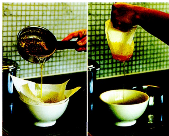
Die Herstellung von Ghee.

1 Topf mit dickem Boden 1 Mulltuch (Stoffwindel) 1 Metallsieb 1 Glas 500 ml