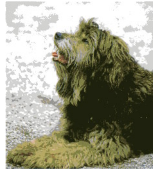
Centaury hilft willensschwachen Hunden.

Häufig finden wir das Centaury-Bild bei Sporthunden wie z.B. Schäferhunden, Riesenschnauzern, ja sogar bei Rottweilern, die andererseits aber auch genau entgegengesetzt reagieren können (siehe Vine).