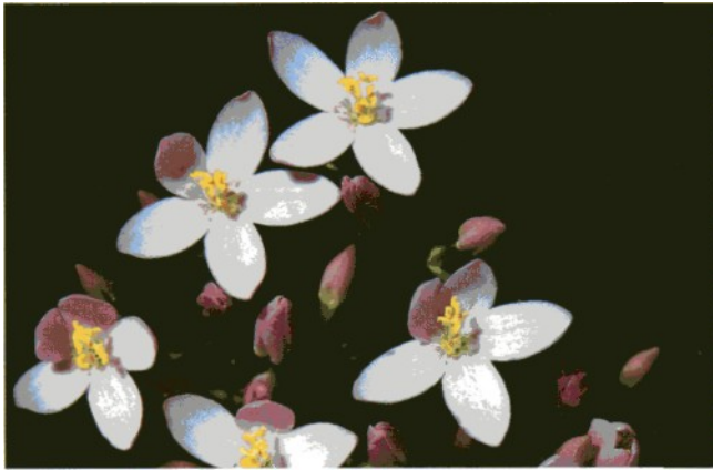
Centaury, die Blüte des Dienens