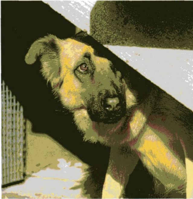
Mißtrauischer, ängstlicher Hund