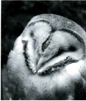
Tyto alba, Schleiereule

Unter den vielen Eulen entschied ich mich für die Schleiereule, Tyto alba . Sie ist unter den Eulen der einzige Kulturfolger und brütet seit Jahrhunderten in Scheunengiebeln und ähnlichen großen Nischen in einiger Höhe. Aus der Mythologie ist sie als Vogel der Weisheit wie als Hexen- oder Teufelsvogel bekannt. Besonders interessant ist, wie viele medizinische Anwendungen diverse Eulensubstanzen (besonders die Eier und Federn) in der Volksmedizin gehabt haben. 1 So ist der Zusammenhang