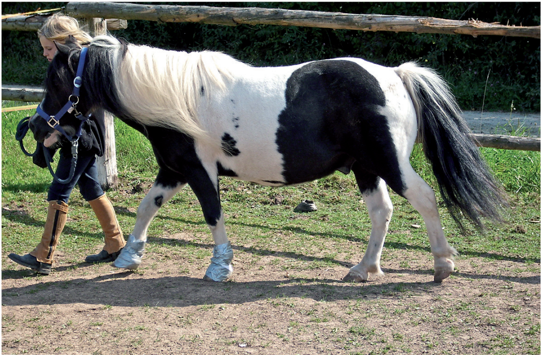
Abbildung 27: Pony während der Behandlung. Die Egel befinden sich unter den Verbänden an den Vorderbeinen.

Ich habe das Shetty im Liegen behandelt, aber schon während die Egel noch saßen, machte es erste Versuche aufzustehen. Zwei Tage später begrüßte es mich stehend und wehrte sich schon ganz ordentlich gegen die Behandlung. Da habe ich die Verbandstechnik erfunden (siehe Abbildung 27). Nach der nächsten Behandlung wieder am übernächsten Tag und einer begleitenden Stoffwechselbehandlung mit biomolekularen Homöopathika nahm er wieder aktiv