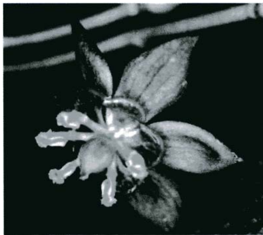
Frucht (oben) und Blüte (unten) von Caulophyllum