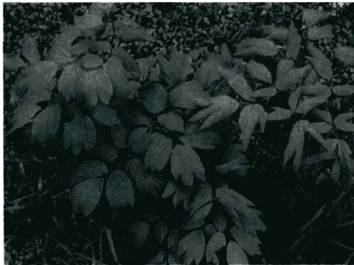
Die oberirdische Pflanze

Die Pflanze wurde erstmals im Jahr 1813 von Peter Smith in einer Publikation mit dem Titel „Medical Facts“ erwähnt. Die erste botanische Erwähnung der Pflanze ist bei Gronovius (1789) zu finden, der die Pflanze von einem Botaniker aus Virginia bekam. Den botanischen Namen Caulophyllum bekam die Pflanze 1803 von Michaux. Das Wort leitet sich aus zwei griechischen Worten her, „kaulos“ wie Stengel und „phullon“ wie Blatt, was soviel wie Stengelblatt bedeutet. So genannt, weil die Blätter so enden, als seien sie eine bloße Fortsetzung des Stengels.