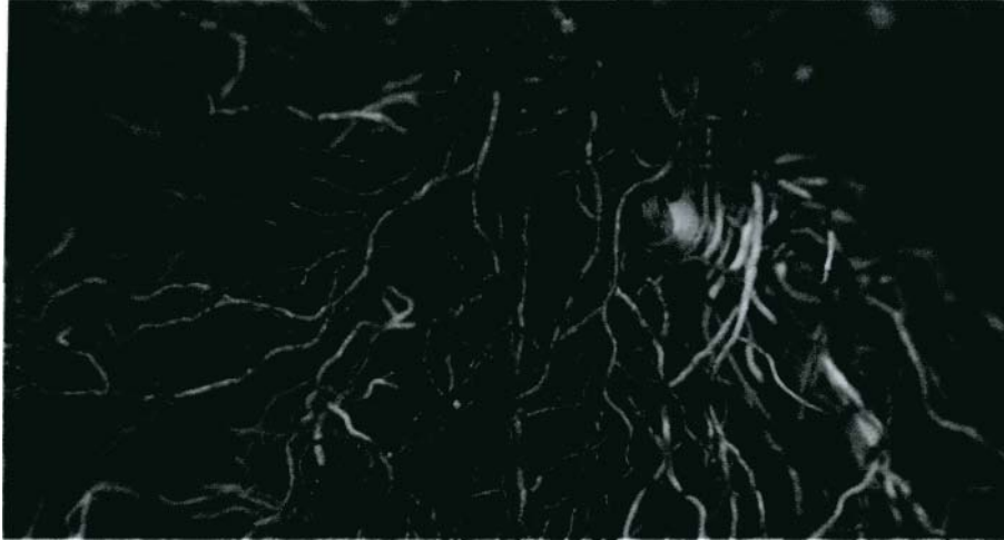
Caulophyllum Wurzeln, schlangenartig ineinander verschlungen

Die Anwendung bei Uterusträgheit und Wehenschwäche war bekannt. Auch die Eigenschaften drohenden Abort zu verhindern, Besserung bei Hysterie, Amenorrhoe, Dysmenorrhoe und Subinvolution des Uterus zu bringen, waren damals bekannt. Bei absichtlicher Überdosis wird auch die Möglichkeit erwähnt, eine Abtreibung vorzunehmen. Bei King (King' s American Dispensatory 1898) wird auch eine Anwendung bei aphthöser Stomatitis erwähnt.