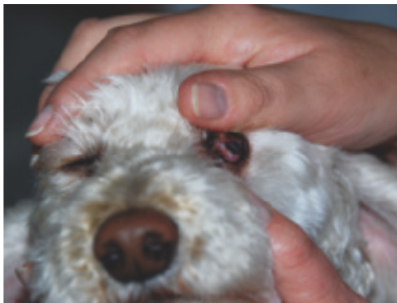
Abb. 2.17 Untersuchung der Lidbinde- häute.

Die Inspektion der Zunge gibt Hinweise auf Pathologien der einzelnen Organe und auf die Art des pathogenen Faktors. Die Zungenmitte spiegelt den Zustand von Milz und Magen wider. Im Bereich der Zungen-