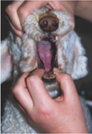
Abb. 2.18 Das Betrachten der Zunge ist nicht immer einfach.

spitze lässt sich beispielsweise die Energie von Herz und Lunge ablesen und die seitlichen Areale lassen Einblicke in die Leberfunktion zu ( Abb. 2.19 ).