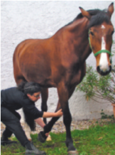
Abb. 4.14 Vorhanddehnung in ADD mit Retraktion.

Reaktion Pferd: Streckreflex nach kaudomedial