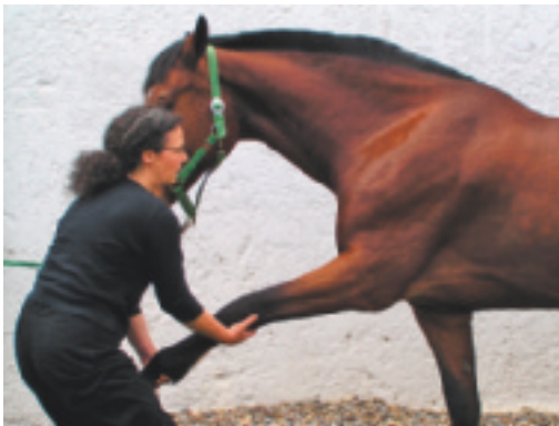
Abb. 4.10 Vorhanddehnung kranial gestreckt.