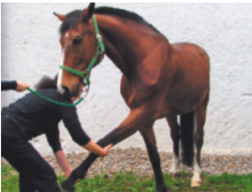
Abb. 4.13 Vorhanddehnung in ADD mit Protraktion.

Handgriff: Vorderbein mit linker Hand am Fesselkopf und rechter Hand am Karpalgelenk nach kraniomedial strecken ( Abb. 4.13 ). In dieser Stellung das