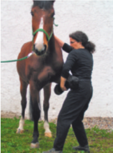
Abb. 4.12 Vorhanddehnung in ABD.