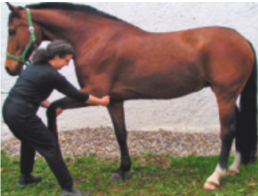
Abb. 4.9 Vorhanddehnung kranial gebeugt.

ASTE Therapeut: links kranial der Schulter des Pferdes