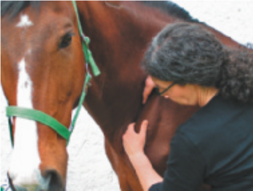
Abb. 4.8 Subskapulartechnik.

der Scapula leicht nach lateral vom Pferd „abheben“ und die profund liegenden Strukturen ca. 1 Minute sanft in der Dehnung halten.