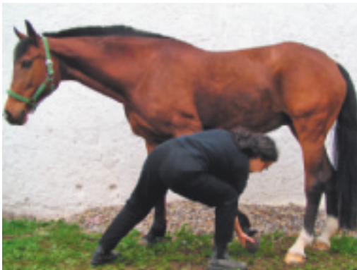
Abb. 4.11 Vorhanddehnung kaudal.