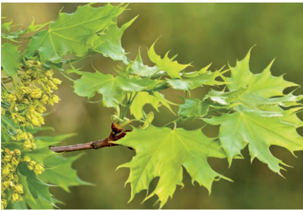
Abb: 6 Blühender Ahorn

Zweifelsfrei birgt das Leben unendlich viele Fragen und es ist wichtig für die eigene Entwicklung, dass wir Fragen stellen. Aber wenn es nur Fragen gibt, so wird es mit den Antworten schwierig, was unbefriedigend