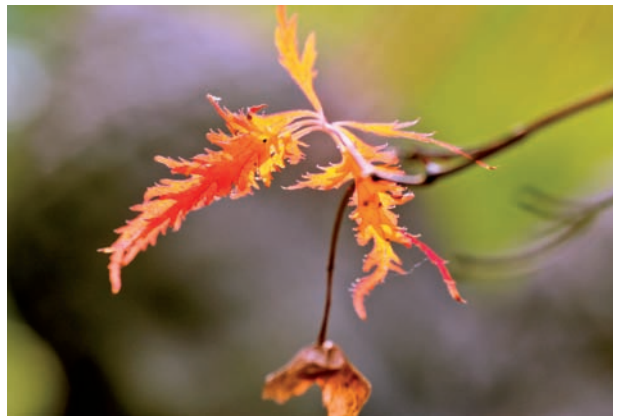
Abb: 4 Ahornfrüchte

Zum Ahorn rechne ich die Rune Gear, was so viel bedeutet wie Jahr, Ernte und Segen. Diese Rune zeigt die Spaltung des Jahres in zwei gleich große Hälften an, wie das am Sonn- und Winterwendepunkt geschieht. Die Spitze des Speeres des Sonnengottes entspricht der Spitze des Jahres und die Blätter des Ahorn sind spitz. Daher rührt entsprechend vielleicht der Name „Spitzahorn“. Das Jahr hat seine höchste