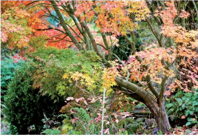
Abb: 5 Ahornbaum im Herbstlaub

solche Haltung mit Sicherheit ein Erlebnis des Versagens fördern. Es wird da die eigene Schattengestalt des Zynikers in uns hervorgehoben, der da sagt: „Das schaffst du nie“. Erwartungen, die nicht unserer Mitte entspringen, bringen uns aus dem Gleichgewicht, was zu einer Schwächung der Zielkräfte führt.