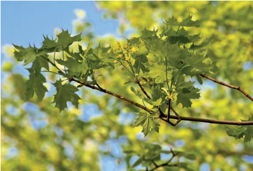
Abb: 7 Ahornblätter im Morgenlicht

Anwendungsbereiche: steter Zweifel, ewige Skepsis, Mangel, Unentschlossenheit, starke Erwartungshaltung, viel Einsatz ohne Feedback, mangelnde Würdigung, übersteigertes oder hitziges Gemüt, zu viel Wollen, Schwierigkeiten sich zu entscheiden, Maßlosigkeit, Perfektionsdruck, Überreizung, Durchhängen.