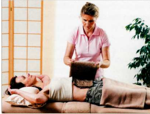
Krampflösend und schmerzlindernd wirkt ein feuchtkalter Leibwickel.

Wirkprinzip: Dieses Mittel aus der Rinde des afrikanischen Okoubaka-Baumes wirkt erfahrungsgemäß gegen Durchfall. Anwendung: 3-mal täglich mindestens 30 Minuten vor oder nach den Mahlzeiten 5 Globuli einnehmen. Das Mittel sollten Sie 3 Wochen lang täglich einnehmen. Bei akutem Durchfall können die Globuli für bis zu 3 Stunden auch alle 10 Minuten eingenommen werden. Kontraindikationen: keine