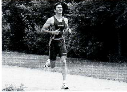
Läufer mit unterschiedlicher Konstitution

Wenn sie verschiedene Menschen betrachten, ihr Erscheinungsbild, ihre Ernährung, ihr Verhalten, ihre Toleranz auf „Umwelteinflüsse“ etc., so stellen Sie fest, dass sich diese Menschen unterscheiden und dass ihre Bedürfnisse völlig unterschiedlich sein können. Das gilt selbstverständlich nicht nur für Menschen, sondern auch für andere Lebewesen, wie z. B. Elefanten oder Pferde etc.