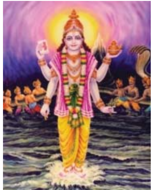
Dhanvantari – der Schutzpatron der Ayurveda-Ärzte.

Dhanvantari wird als der Arzt der Götter verehrt und gilt als frei von menschlichen Schwächen und als ein Meister universaler Erkenntnis. Im Ayurveda ist Dhanvantari heute so etwas wie der Schutzpatron der Ayurveda-Ärzte. Er wird in Tempeln verehrt und in Statuen und Gemälden vierhändig mit dem goldenen Kalash, einem Gefäß, das symbolisch die Heilkraft des Ayurveda enthält, dargestellt.