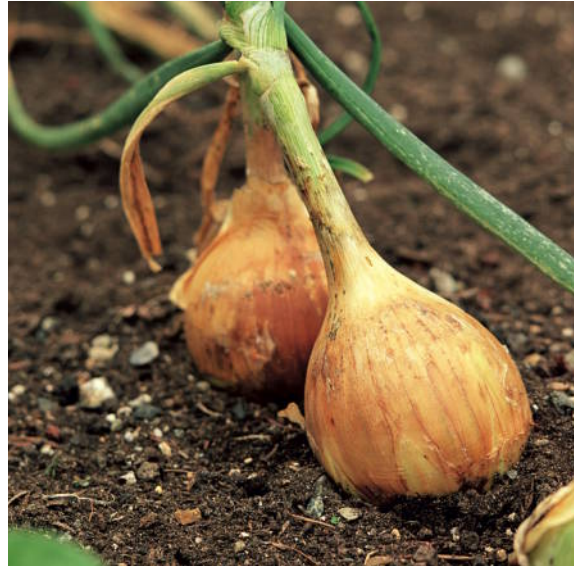
Allium cepa wird aus dem frischen Saft der Speisewiebel gewonnen.

Hinweis: Allium cepa und Euphrasia (Seite 51) haben beide Fließschnupfen und tränende Augen als Leitsymptome. Allium cepa hat einen scharfen, wund machenden Schnupfen und milde Tränen, Euphrasia einen milden Schnupfen und scharfe, wund machende Tränen.