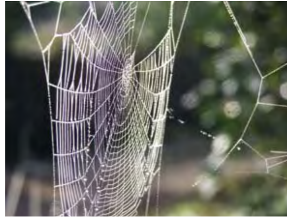
Der Spinnen Webkunst...

Auch in den folgenden Klagen über Gott, die Welt und ihre Beschwerden findet sich unser erkrankter Mensch wieder, der seinen Unmut in oft hypochon-