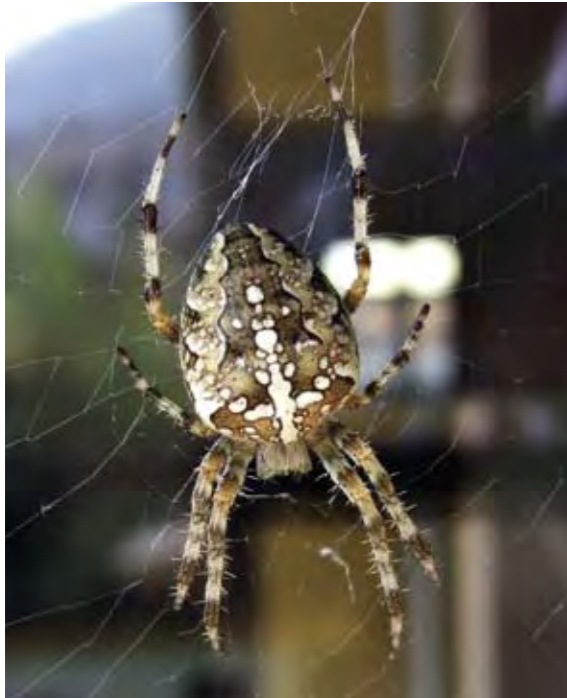
Die Kreuzspinne umgarnet ihr strampelndes Opfer, bevor sie es tötet. Ihr Kreuz erhielt sie der Legende nach durch den Schatten des Kreuzes Christi, der auf ihren Körper fiel.