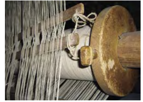
Der Menschen Webkunst...

Entsprechend dem lähmenden Nervengift der Spinne und dem Erwartungsdruck seines Umfeldes verändert er unbewusst sein Verhalten, verfällt in lähmige Introvertiertheit, in schweigsame Traurigkeit und in eine wirklichkeitsfremde Schüchternheit, in der er weder angesprochen noch berührt werden will. Das heißt, er entscheidet sich autoaggressiv gegen das Leben, kann nicht atmen, wirkt ungelenkt, linkisch, hilflos, verbittert, verzweifelt, stets mit angespannter ruckender, zuckender Muskulatur.