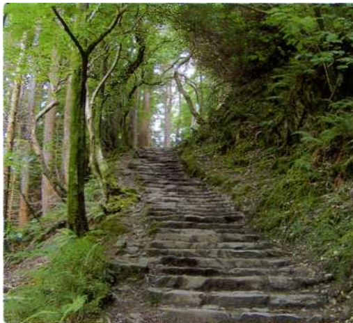
> Abb.4.T Stufen - Der Weg des Lebens und des Sterbens.

In der Begleitung von sterbenden Menschen ist die Gefahr für den Begleitenden sehr groß, in einen Strudel von Emotionen, Verwirrung und Abhängigkeiten hineinzugeraten.