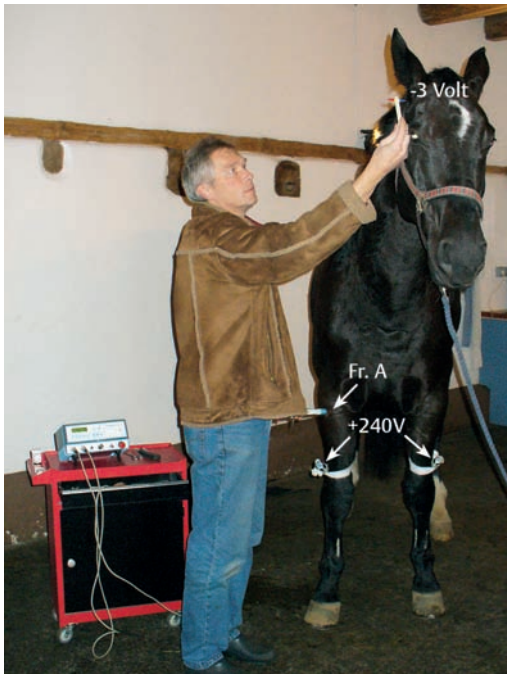
► Abb. 15.1 Mittlere Schicht beim Pferd mit peripherer Auflage der Frequenz A, Suche nach dem Störherdhinweispunkt mit -3 Volt.