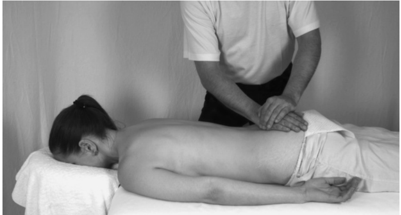
Abb. 11.1 Strecken

Von hier aus streicht der Therapeut über Kreuzbein und Steißbein bis zum unteren Gesäßanteil.