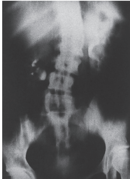
Abb. 8: Senkung der rechten Niere

in solchen Fällen gesteigert werden kann, wenn auch meist nur vorübergehend. Doch es zeigt, dass eine Behandlung indiziert ist.