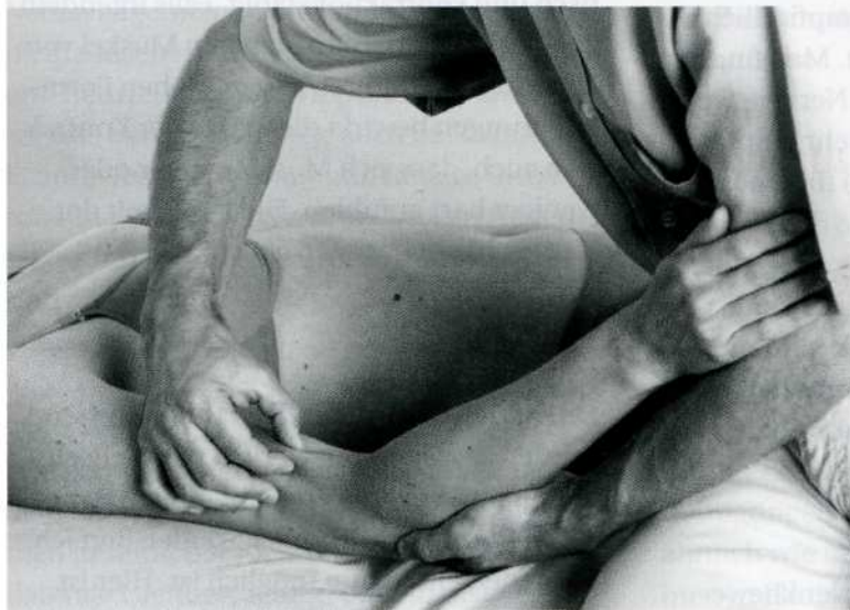
Abb. 4.2: Pinzettengriff

Haut und Unterhaut hoch (Fingerkuppen im rechten Winkel zur angenommenen Verlaufsrichtung des Nervs). Die Falte wird behutsam zwischen den Fingerkuppen hin und her gerollt. Vorsicht: Die Haut darf nicht gezwickt werden, das wäre schmerzhaft. Gemeint ist kein grobes Durchkneten, sondern ein feinfühliges Bewegen, um die unterschiedliche Gewebebeschaffenheit wahrzunehmen. Wenn in der Hautfalte auch ein oberflächlicher Nerv aufgegriffen wurde, kann man ihn mehr oder weniger deutlich als winzige