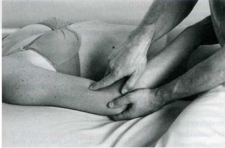
Abb. 4.1: Finger über die Haut gleiten lassen