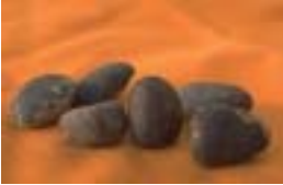
Samen des Ignatiusbohnenbaums.

Der Ignatiusbohnenbaum ist ein dornloser, immergrüner Strauch mit armdickem Stamm, der mit holzigen Ranken klettert. Seinen Namen erhielt er nach Ignatius, dem Patron der Jesuiten, der die Samen zuerst nach Europa brachte. Er wächst in Kotschinchina und auf den Philippinen.