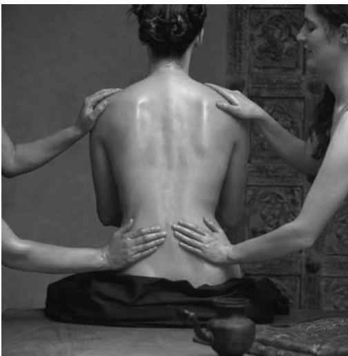
Abb. 16.1 Wohltuende Massage mit hochwertigem Öl.

Neben den Bitterdrogen gibt es eine Reihe von Heilmitteln im Ayurveda, die generell „ hauttherapeutisch “ ( kuṣṭha-ghna ) wirken. Einige fördern die „Färbung“ und somit die Schönheit der Haut ( vārṇya ). Andere verbessern die Qualität der Haare ( keśya ) und können auch als haarwuchsfördernde Drogen ( roma-saṅjanana ) eingesetzt werden. Wundheilende ( ropana ), kühlende ( uṣṇa-praśamana ), desodorierende ( pūti-hara ), entzündungs- und schwelgereduzierende ( śoṭha-hara ) und juckreizlindernde ( kaṇḍū-ghna ) Mittel sind ebenfalls bekannt.