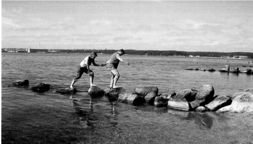
Abb. 1.1: Über Steine balancieren.

Wenn wir unsere Bewegungskompetenz erweitern wollen, dann ist die eigene Bewegungswahrnehmung von Bedeutung. Wir können unsere automatisierten Bewegungen verändern und an die jeweilige Situation anpassen. So erweitern wir unser Bewegungspotential. Die Fähigkeit zur Anpassung und Veränderung beeinflusst zudem die Gesundheit. Sie bietet uns z. B. die Möglichkeit rechtzeitig wahrzunehmen, wann wir uns übermäßig anstrengen, die Balance verlieren oder unserem Rücken bzw. unseren Gelenken schaden. Das wiederum hilft uns Varianten in unseren Bewegungsabläufen zu entwickeln und zu entdecken, wie wir etwas leicht und mit der nötigen Balance tun können. Wenn wir anderen Menschen eine Bewegungsunterstützung oder ein Lernangebot bezüglich Bewegung geben, hilft uns die Sensibilität im eigenen Körper. Damit ist unsere eigene Bewegungswahrnehmung auch eine Ressource für andere Menschen.