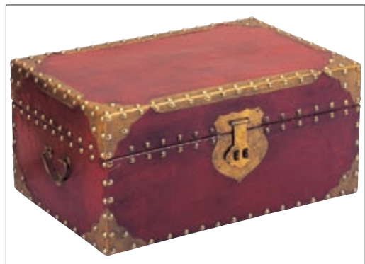
► Abb. 10.1 Heben Sie die Schätze, die sich im GebüH verbergen.

Die im GebüH genannten Beträge erscheinen auf den ersten Blick enttäuschend. Das GebüH ist dessen ungeachtet die Abrechnungsgrundlage des Heilpraktikers und er muss sich damit seine wirtschaftliche Existenz sichern. Dies wird ihm nur dann gelingen, wenn er die richtigen Ziffern-