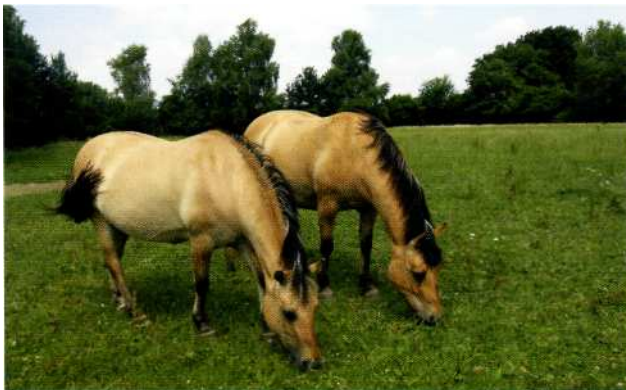
Norwegerponys sind meist typische Vertreter von Mangelbild Nr. 9.

Der Speicher von Nr. 9 ist die Lymphe. Natrium phosphoricum kommt bei allen Störungen im Stoffwechsel zum Einsatz, deren Ursache in der Übersäuerung des Organismus liegt. In Blut- und Gewebeflüssigkeit, in Gehirn-, Blut-, Muskel- und Nervenzellen hilft es, die Säuren abzubauen. Es verwandelt z.B. die Harnsäure in Harnstoff und macht dadurch