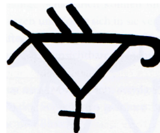
Schamanenvogel der nordamerikanischen Hopi, Symbol des Papageienclans ( Parrot, karro ). Papageien sind Vögel der Sonne sowie des Südens (ihrer Heimat). Ihre bunten Federn werden in Ritualen und Tänzen verwendet. Vögel, die mit einem Clan assoziiert sind, wurden früher als »Totem« bezeichnet. (Petroglyph, Willow Springs, Arizona, USA)

Wochen später saßen Chan K'in und ich im Götterhaus. Als es dunkel wurde, fachten wir das Feuer an. Wir verbrachten dort aus rituellen Gründen die Nacht, um die Gärung des Balche'-Tranks zu überwachen. Wir räucherten Copal für die schützenden Götter und Göttinnen und achteten darauf, dass sich dem heiligen Bezirk kein in einen Jaguar verwandelter Zauberer näherte.