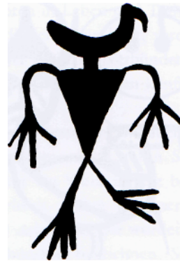
Schamane mit einem Vogel (vielleicht einer Spottdrossel) als Kopf. Stellt er seine »totemistische« Abkunft dar? (Petroglyph, Canyon del Muerto, North Arizona, USA)

Als ich nach Naha' zurückkehrte, ging ich eilends zu Chan K'in, um ihm von meiner Traumoffenbarung zu berichten. Er saß im Schimmer des Herdfeuers, blickte kurz auf und sagte beiläufig, er hätte schon lange gewusst, was mein Oonen sei. An diesem Abend war er nicht besonders gesprächig.