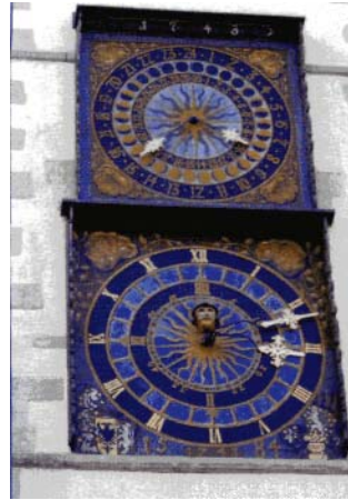
Die Uhren am historischen Rathaus

Theater, Naturkundemuseum, die Städtischen Sammlungen für Geschichte und Kultur mit Kulturhistorischem Museum, Schlesisches Museum,