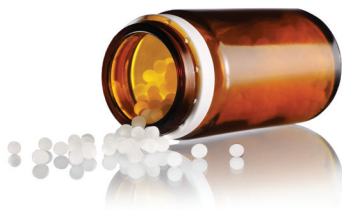
Stabilität mithilfe der Homöopathie

Dieses Buch ist das erste mit aktuellen Fallberichten über schwierige Kinder, denen eine homöopathische Behandlung geholfen hat. Beschrieben werden Verhaltensweisen, die mit ADHS, Allergien, Autismus, Unruhe, Depressionen, Ekzemen und Ängsten einhergehen. Die lebendig dargestellten Geschichten spiegeln die Höhen und Tiefen, das Auf und Ab – „ungeschminkte“ Erfahrungen mit der Homöopathie wider. Der Leser findet leicht Zugang zu den Beispielen, die Inspiration, Einsicht und Hoffnung für jeden bereithalten, der mit schwierigen Kindern lebt bzw. arbeitet.