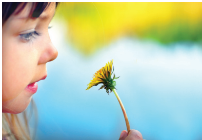
Kinder verlieren sich oft in Tagträume