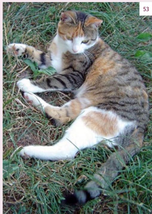
Dieselbe Katze »mit gezückter Kralle« ein Jahr später.