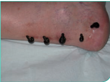
Ansetzen der Blutegel auf Verwachsungen nach einer Achillessehnen-Operation

Die Achillessehnenentzündung ist mit Blutegeln sehr gut behandelbar. Die Egel werden lokal angesetzt. In der Regel werden 4-8 Egel in das betroffene Gebiet gesetzt. Je nach Reaktion des Patienten kann es notwendig sein, die Behandlung mehrmals zu wiederholen.