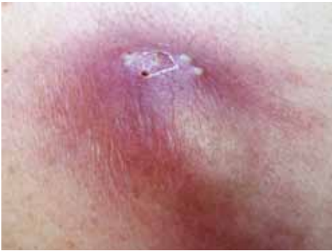
Abb. 45: Karbunkel

Durchmesser bis zu 13 cm oder mehr. Junge Personen oder solche mit robustem Naturell werden nur selten befallen. Beim Karbunkel treffen mehrere Furunkel und gangränöse Veränderungen aufeinander. Prädilektionsstellen sind die Haut entlang der Wirbelsäule, das Genick, inguinal und sternal. Karbunkel können bei abgemagerten und robusteren Menschen auftreten. Der Krankheitsverlauf steht meist mit großen Schmerzen in Verbindung.