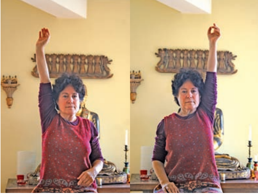
Abb. 101 und 102 „Arme werfen“