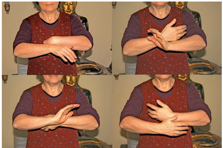
Abb. 104 a-d „Garn wickeln“