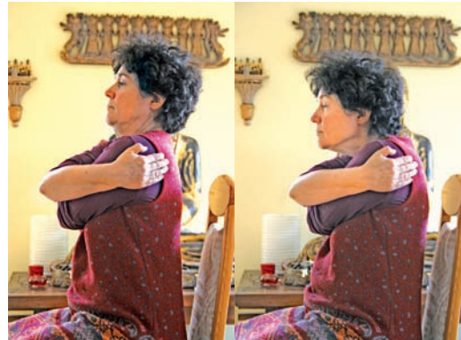
Abb. 98 und Abb. 99 „Vogel Strauß-Übung“