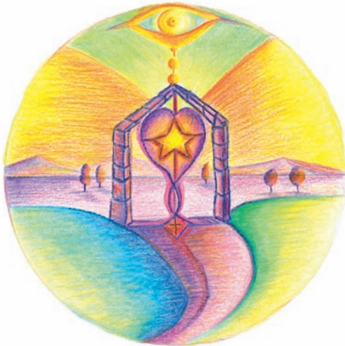
Abb. 72 Das Herzcakra