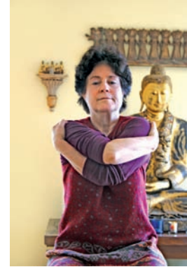
Abb. 97 „Grundhaltung“