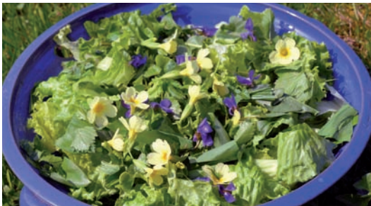
Abb. 5 Essbare Blüten

Im Jahreslauf ist die große Zeit des Granatapfels der Herbst und der Winter, wenn alles in der Natur und im menschlichen Organismus ruhiger wird. Dabei neigen wir zur Blutverdickung und Blutverschlackung, weil wir in der Ernährung oft nicht auf diese Zeichen der Natur achten und weiterhin zu viel feste Nahrung zu uns nehmen. Im Herbst wäre es vielmehr angebracht, stärkehaltige Nahrung wie Brot und Nudeln zu reduzieren und dafür mehr Gemüse wie Auberginen, Schwarzwurzeln und – solange noch erhältlich – Artischocken in den Speiseplan zu integrieren. Pro Tag der Rohsaft von 1 Granatapfel, eventuell gemischt mit dem von 2 Äpfeln, sorgt für eine optimale Viskosität und Reinheit des Blutes und ist eines der besten Nervenbaumittel in der dunklen Jahreszeit. Nervosität und Blutarmut werden gleichermaßen durch diese wertvolle Frucht behoben.