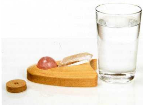
Einstrahlen von Bergkristall in Wasser

Es wird ein klarer Bergkristall benötigt, dessen Spitze z. B. mit einer Stütze aus Knetwachs auf das Glas Wasser gerichtet ist und an dessen flacher polierter Basis der zu übertragende Heilstein platziert ist. Das Einstrahlen dauert etwa