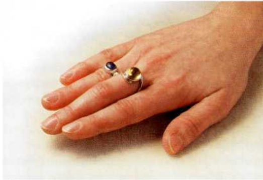
Ring mit Heilstein

tigste Edelsteine als Ring im Jyotish, der indischen Edelstein-Astrologie, kann an dieser Stelle nicht eingegangen werden. Anwendungsbereiche: systemische Erkrankungen des Kreislaufs, der Lymphe und vor allem psychisch ausgelöste oder psychisch verstärkte Erkrankungen.