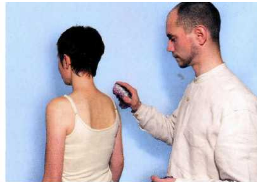
Ausstreichen mit Amethyst

Anwendungsbereiche: Amethyst wirkt insbesondere auf die Gehirnhäute, die Gesichtssinne, die Haut, die Bronchien, den Dickdarm sowie allgemein auf die Verdauung, das Immunsystem und den Lymphfluss.