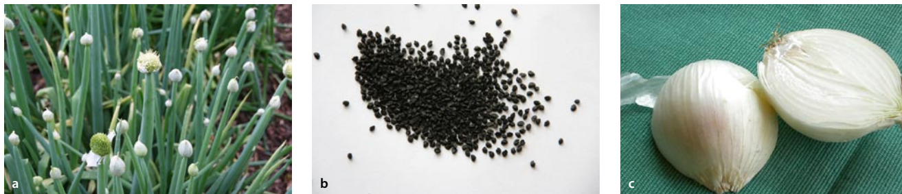
Abb. 9.4a–c Allium cepa L.; Küchenzwiebel (a Pflanze, b Samen, c Zwiebel)

Deutsch ▶ Küchenzwiebel , Englisch ▶ onion , Sanskrit ▶ palāṇḍuḥ , Hindi ▶ pyāj , Malayalam ▶ cuvannuḷli , Tamil ▶ veṅkāyam , irullī