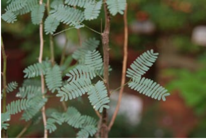
■ Abb. 9.1 Acacia catechu (L. f.) Willd. (Fabaceae); Indische Gerberakazie

Deutsch ▶ Indische Gerberakazie, Catechubaum , Englisch ▶ crutch tree, black catechu , Sanskrit ▶ khadirāḥ, gāyatri , Hindi ▶ khair, khairā , Malayalam ▶ kariññāli , Tamil ▶ karuñkāli