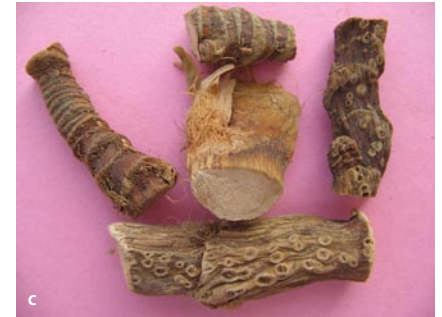
■ Abb. 9.2a–c Acorus calamus L. (Acoraceae); Kalmus (a, b Pflanze, einzeln und im Verbund; c getrocknetes Rhizom)

Deutsch ▶ Kalmus , Englisch ▶ sweet flag , Sanskrit ▶ vacā, ugragandhā, ugrā, ṣaḍgranthā , Hindi ▶ bacc, gorabācc , Malayalam ▶ vayāmpu , Tamil ▶ va-śāmpu