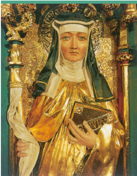
Hildegard von Bingen (1098–1179). Altar-Figur in der Rochuskapelle, Bingen.

Darüber hinaus verbanden die Menschen mit Edelsteinen und Metallen schon früh heilende und sogar magische Kräfte. Bei vielen Völkern wurden bereits vor Jahrtausenden Edelsteine bzw. Amulette aus Stein oder Metall zum