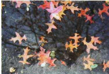
Titelbild: Abelina Mijwaart