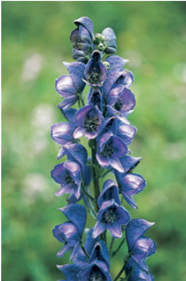
Abb. 32 Der Blaue Eisenhut war sowohl im Altertum wie auch im Mittelalter als tödliches Gift in Gebrauch.