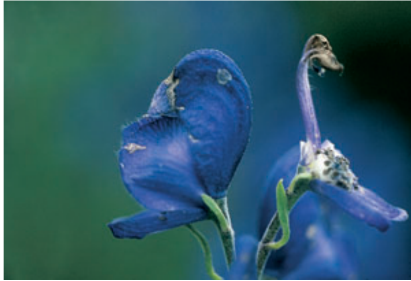
Abb. 31 Die aufgeschlitzte Blüte sieht aus wie ein Venuswagen, was den Volksmund zur Namensgebung veranlasste.

In der Botanik trägt der Blaue Eisenhut den Namen „ Aconitum napellus “. Die Gattungsbezeichnung „ Aconitum “ stammt von Theophrastus von Eresos und nimmt Bezug auf die Stadt Aconae, wo die Pflanze in griechischer Antike ihren Standort hatte. Nach Plinius sec. jedoch bedeutet „aconae“ eine nackte Felsenklippe, was ebenfalls das Verbreitungsgebiet am Mittelmeer