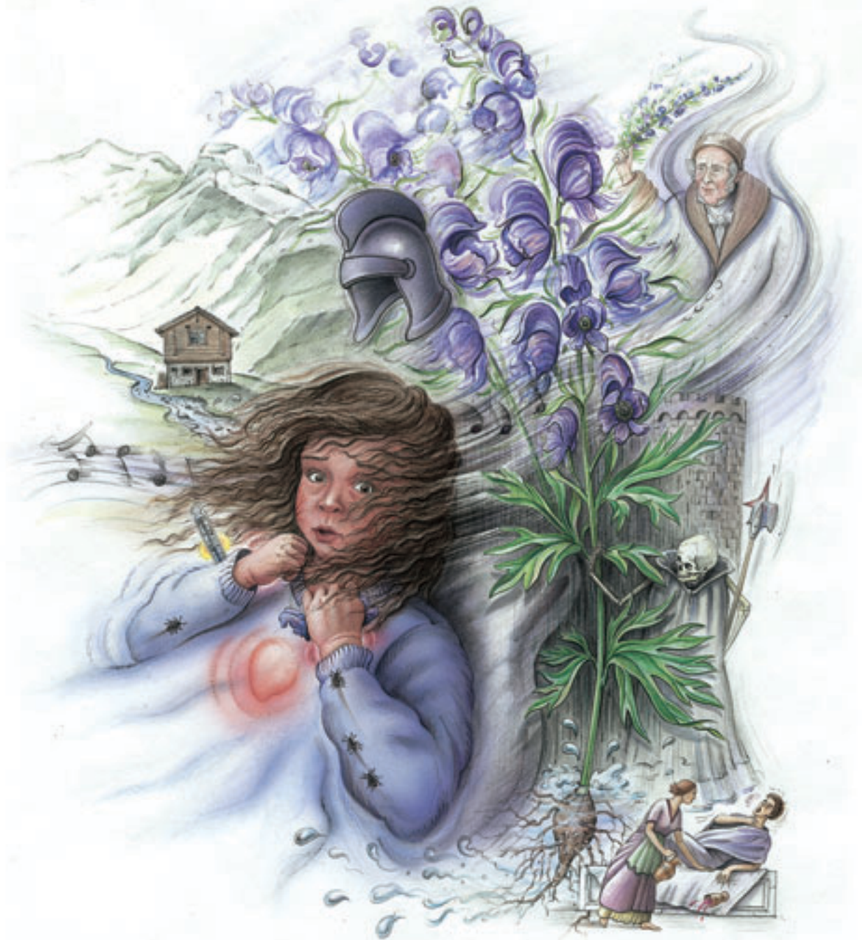
Abb. 34 Aconitum-Kinder erwachen plötzlich in der Nacht mit ängstlicher Unruhe, raschem Temperaturanstieg und trockener Hitze. Sie werfen sich im Bett hin und her und klagen fürchterlich über Schmerzen – sie fürchten sich bald zu sterben. Die Kinder besitzen während ihrer entzündlichen Erkrankungen einen unstillbaren Durst auf kalte Getränke.