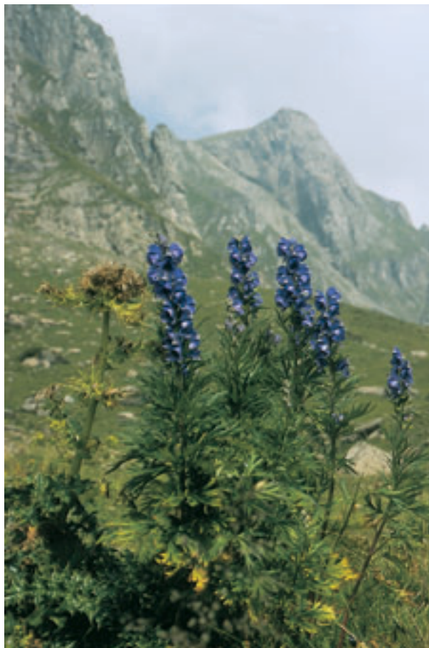
Abb. 33 Aconitum ist vielfach zu Beginn einer akuten Erkrankung mit hohem Fieber ohne Schwitzen indiziert. Die Krankheit kommt wie ein Sturm und geht wie ein Sturm vorüber.

Zuweilen ist in diesen akuten Krankheits-Fällen eine homöopathische Zwischenarznei für die nach zwölf- oder sechszehnstündiger Wirkung der ersten Sturm-