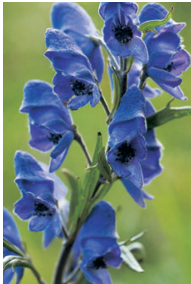
Abb. 28 Die Blüte gleicht einer mittelalterlichen Hirnhäube (einem eisernen Helm), wie sie die Landsknechte auf dem Kopf trugen.

ceen) mit ihren gestielten fünf- bis siebenteiligen, handförmigen Blättern samt schmalen linealen Abschnitten, ist im Mittel- und Hochgebirge Europas bis auf 3000 m Höhe zu finden, und zwar vorwiegend auf feuchten, humosen Bergwiesen, an Wasserläufen und in der näheren Umgebung von Sennhütten. Obwohl der Eisenhut eine typische Bergblume ist, begegnet man ihm vereinzelt auch in tieferen Regionen. Bei der prähistorischen Ausdehnung der Gletscher wurde er gleichsam mit anderen Alpenpflanzen von den Eisströmen ins Tiefland verschleppt und blieb nach dem Rückgang der Eismassen als Pionierpflanze zurück. Heutzutage ist die Pflanze auch in Parks und Hausgärten als Zierblume anzutreffen.