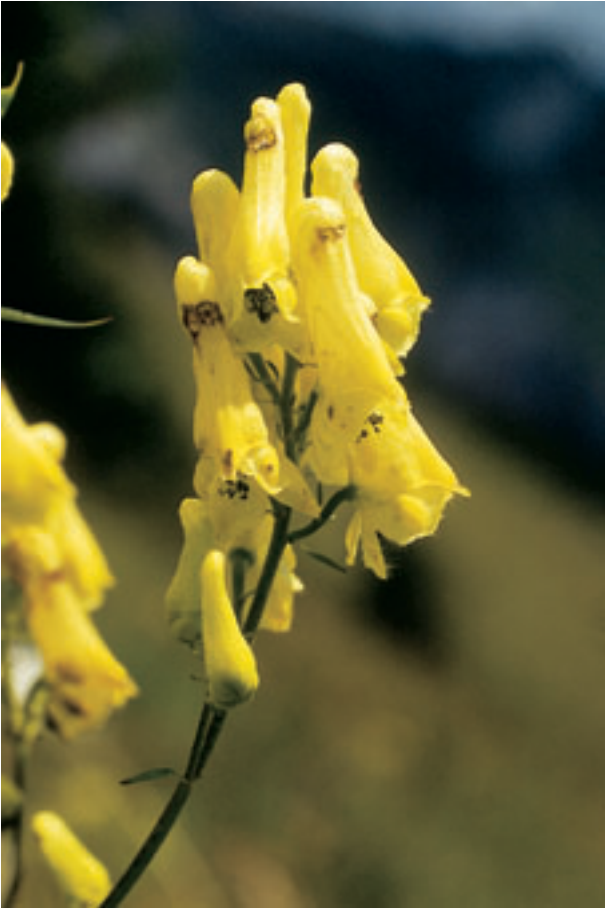
Abb. 30 Gelber Wolfs-Eisenhut ( Aconitum vulparia ), der gelbe Bruder des Blauen Eisenhutes.

In der Wildnis der Berge sind weitere Geschwister des Blauen Eisenhutes zu finden, z.B. der violett oder scheckig blühende Bunte Eisenhut ( Aconitum variegatum ), der in der Schweiz vor allem im Bündnerland vertreten ist, ferner der blau blühende Rispige Eisenhut ( Aconitum paniculatum ) und schließlich der Gelbe oder Wolfs-Eisenhut ( Aconitum vulparia Rchb., auch Aconitum lycoctonum L. genannt), welcher in der Homöopathie als Kleines Mittel der Wahl bekannt ist. Letztgenannter besitzt blassgelbe Blüten mit walzenförmigen, an der Spitze aufgeblasenen Helmen. Der Name Wolfs-Eisenhut geht auf die frühere Verwendung zum Vergiften von Wölfen und Füchsen zurück.