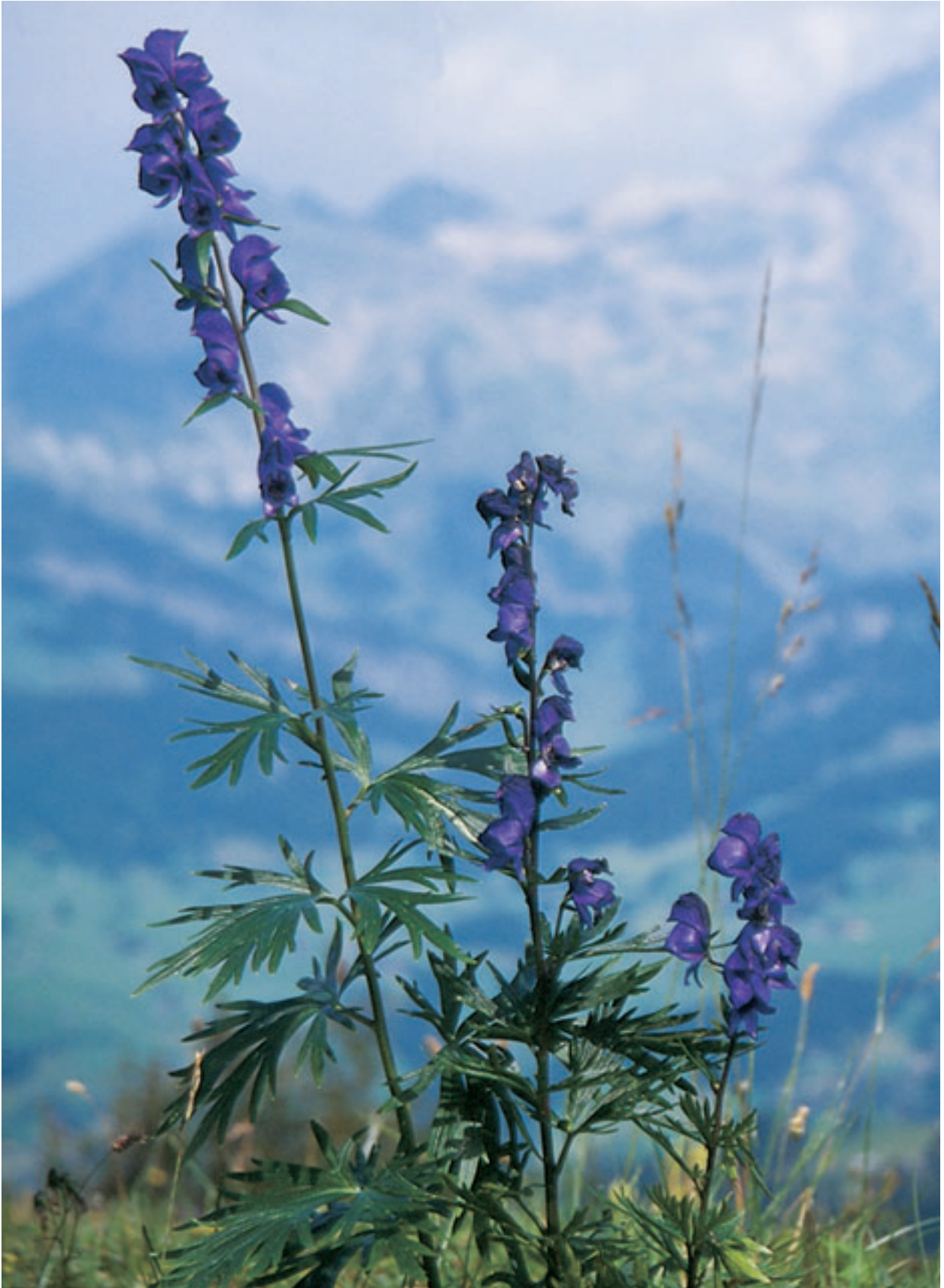
Abb. 29 Der Blaue Eisenhut ( Aconitum napellus ), faszinierende Blütengestalt der Berge.