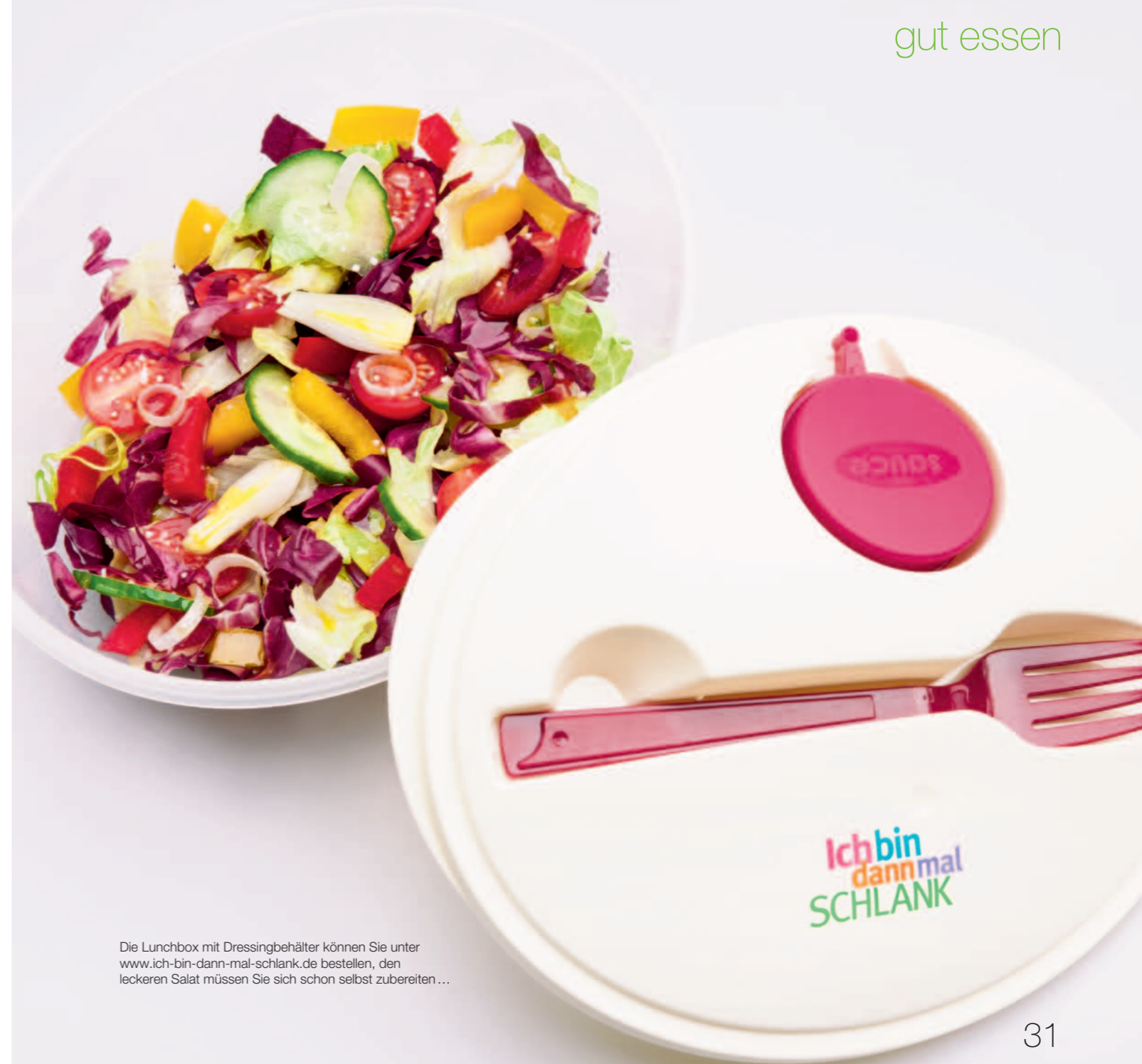
Die Lunchbox mit Dressingbehälter können Sie unter www.ich-bin-dann-mal-schlank.de bestellen, den leckeren Salat müssen Sie sich schon selbst zubereiten...

Der Schlechtes-Gewissen-Macher Ein Kollege greift zum zweiten Brötchen? „Huch, wie schaffst du bloß so viel am Morgen?“ – Das Team trollt sich in die Kantine? „Müsst ihr dauernd futtern? Ich arbeite lieber durch.“ – Die Praktikantin sagt beim Nachtschicht nicht nein? „Wahnsinn, was die runterkriegt. Ich könnte das nicht.“ Wer anderen ein schlechtes Gewissen macht, indem er beim Essen übers Nicht-Essen redet, verdirbt allen den Spaß. Erste Hilfe: Stellen Sie Kollegen nicht bloß, indem Sie Ihre Gewohnheiten lauthals zum Maßstab für andere machen.