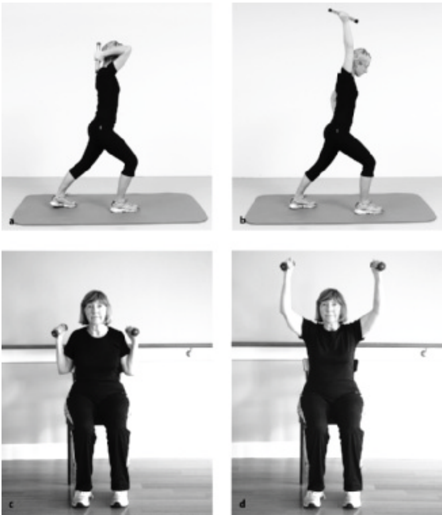
► Abb. 12.14 Ellenbogenextensoren in Schulterflexion.