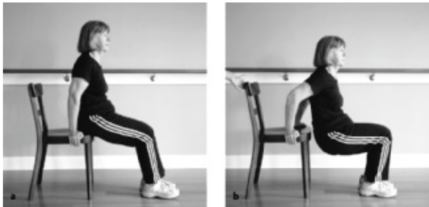
► Abb. 12.15 Ellenbogenextensoren - Armstrecker.

Durch weiteres Wegstellen der Füße wird die Übung anstrengender.