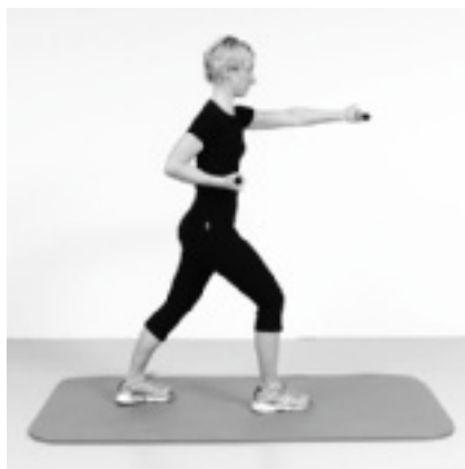
► Abb. 12.17