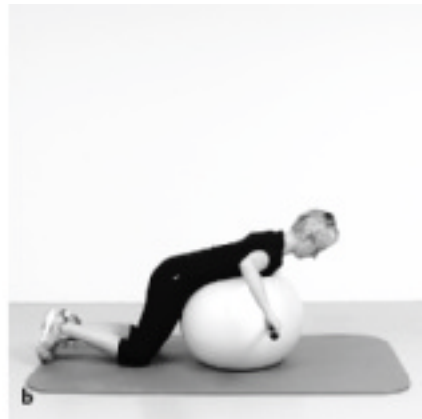
► Abb. 12.16 Rowing auf dem Ball.