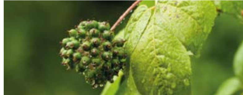
Die Taigawurzel sorgt für ein ausgeglichenes Gemüt.

In einigen Studien war Ingweröl mit Magnolia kombiniert worden, was zu beachtlichen Ergebnissen bei der Behandlung von Depression führte. Die Serotoninwerte im Gehirn sowie die Noradrenalin-Spiegel im präfrontalen Cortex stiegen deutlich an, nachdem subklinische (inaktive) Magnolia-Dosierungen dem Ingwer zugegeben wurden.