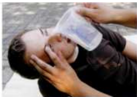
Abb. 13.2 Augenspülung: Das Auge am besten mit einem Tupfer offen halten. Die Spüllösung oder klares Wasser aus 10 cm Entfernung von innen nach außen laufen lassen. Werden Säuren, Laugen oder andere Chemikalien ausgespült, muss der Helfer zum Selbstschutz Handschuhe tragen. [FLA]

Ein Glaukom entwickelt sich meist über einen längeren Zeitraum. Bei einem akuten Glaukomanfall dagegen erhöht sich der Augeninnendruck plötzlich.