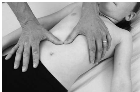
► Abb. 13.3 Untersuchung des Omentum minus.