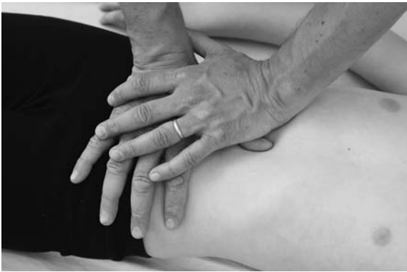
► Abb. 13.6 Untersuchung der Pylorusmobilität.