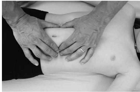
► Abb. 13.7 Untersuchung der peritonealen Verbindungen des Duodenums.