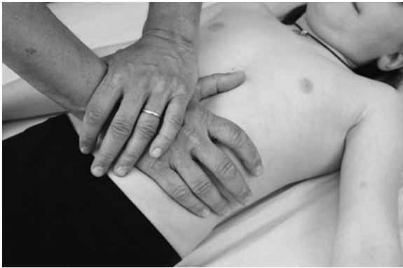
► Abb. 13.4 Untersuchung der Bursa omentalis.