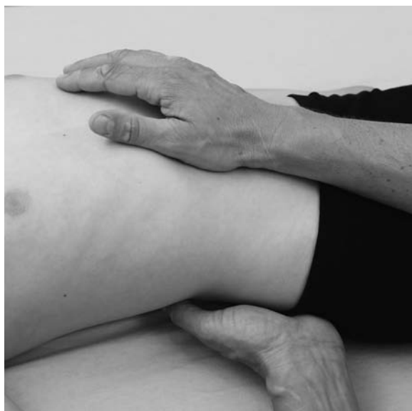
► Abb. 13.9 Untersuchung der Pankreasmobilität.