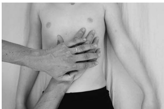
► Abb. 13.10 Untersuchung der Pankreasmotilität.