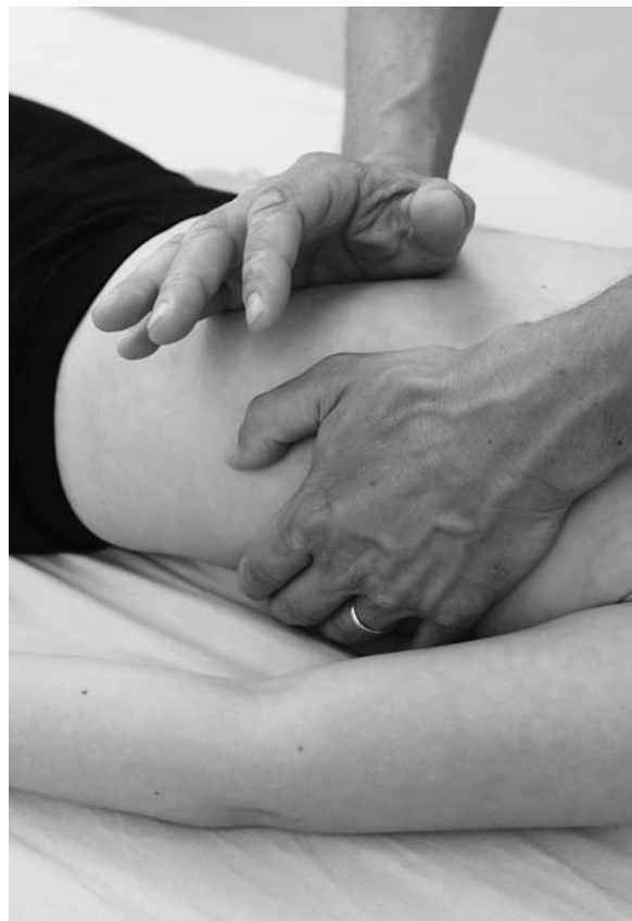
► Abb. 13.2 Untersuchung des Lig. gastrosplenicum.

Das Kind liegt auf dem Rücken. Man steht auf der rechten Seite des Kindes. Man legt die rechte Hand auf den Magen und verschiebt diesen vorsichtig nach dorsal (►Abb. 13.4). Fühlt man einen Widerstand, versucht man, den Magen nach superiolateral und inferiokaudal zu verschieben. Sind Restriktionen vorhanden, wird die Bewegung eingeschränkt sein.