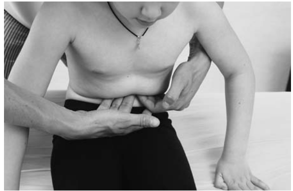
► Abb. 13.5 Untersuchung der Verbindung Magen – Leber.