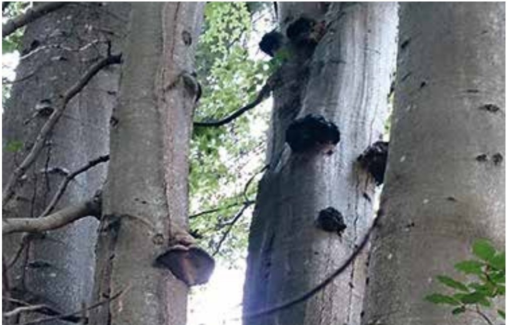
Buchen mit Zunderschwamm

„Meine Schnupfenanfälle kommen immer wieder. Ich fühle mich von ihnen bedroht und attackiert. Wenn die Symptome am Höhepunkt sind, bin ich in einer ausweglosen Situation. Am liebsten würde ich flüchten, davonlaufen, aber ich stecke fest. Die allergischen Anfälle überfallen, die attackieren mich. Sitze da, angewurzelt und fühle mich wehrlos, hilflos. Eine mir nicht fassbare Macht scheint sich mir überzustülpen, gegen die ich ohnmächtig bin. Nichts hilft, nichts hat bisher heilenden Erfolg gebracht. Ich bin in großer Verzweiflung. Nach einer gewissen Zeit sind die allergischen Anfälle wieder weg, als wäre nichts gewesen. Ich vergleiche sie mit einer großen Feuersbrunst, die über die Landschaft fällt. Die Bäume stehen angewurzelt an ihrem Ort, sind hilflos und können vor der Bedrohung nicht weglaufen. Wehrlos müssen sie sich den Angriff über sich ergehen lassen. Sie werden vom Feuer ausgehöhlt, doch ohne Rauch, Hitze und Qualm. Sie tun mir sehr leid. Anschließend wird es dunkel, ganz finster, ganz still und nichts mehr bewegt sich. Dann ist alles vorbei und der Alltag beginnt von Neuem, der Kreislauf des Lebens setzt wieder ein.“