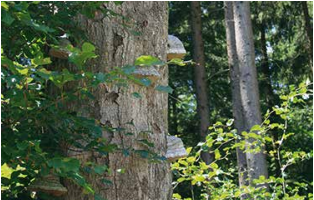
Buchen mit Zunderschwamm

Die Welt der Pilze und der angrenzenden Gebiete haben mich ihren Bann gezogen und wollte sie in ihrer Tiefe verstehen. Viele Zusammenhänge zeigten sich: verwoben, wie das Geflecht der Pilze im Waldboden, vernetzt, riesengroß, geheimnisvoll, versteckt. Die