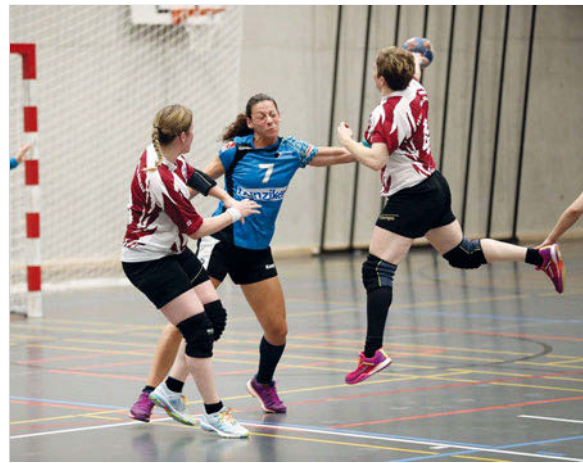
Abb. 7.2 Spielerin während einer Abwehraktion.

Anders als man es möglicherweise bei einer solchen Spielerin erwarten würde, ist nicht die dominante rechte Schulter, sondern die nicht dominante linke Schulter betroffen. Zudem ereignete sich die Verletzung während einer Abwehraktion. Wir werden daher die HR-Spielposition in der Abwehr etwas eingehender analysieren (► Abb. 7.2).