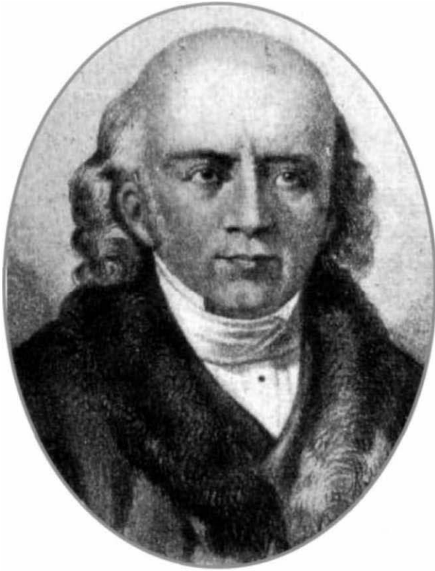
Christian Friedrich Samuel Hahnemann