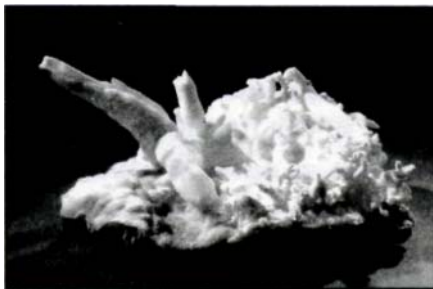
Abb.: Eixi'nhlülü: Fundort Sleiermuirk

Elementares Eisen ist äußerst selten und wird fast nur als Meteoriteneisen gefunden, das vor ca. 6000 Jahren auch die erste Quelle für die Nutzung des reinen Metalls darstellte. Reines Eisen ist silberweiß, weich, dehnbar und ziemlich reaktionsfreudig, weshalb auch kein gediegenes Eisen im Erz vorkommt. Die Gewinnung durch Reduktion mit Kohle erfolgte um ca. 1400 v. Chr. und wurde wegen der vorgefundenen Werkstoffeigenschaften, die z.B. Waffen den bisherigen Bronzeschwertern weit überlegen machten, als Staatsgeheimnis gehütet. Ab ca. 1200 v. Chr. begann mit dem allgemeinen Gebrauch von Eisen die Eisenzeit. Eisen ist nach Aluminium das zweithäufigste Metall. Es tritt zumeist als Oxid oder Sulfid auf. Aus dem Magma abgeschiedene Gesteine enthalten zweiwertiges, die Verwitterungsprodukte dreiwertiges Eisen. Die roten, braunen und gelben Farbtöne des Erdbodens rühren vom \text{Fe}_2\text{O}_3 her.