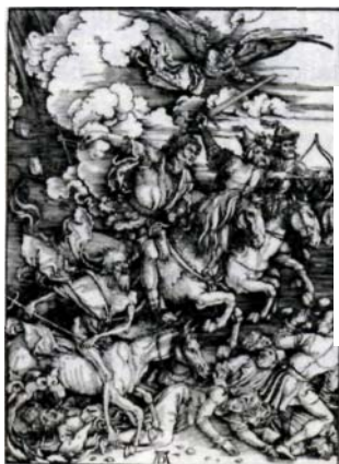
•19. Jh.: Dürer, Die apokalyptischen Reiter

Der harte Lebenskampf wird gelebt in mühseligen Entwicklungsschritten, wie z.B. langsamem, zähem Geschäftsaufbau mit einer geradezu apokalyptischen Neigung zu Rückschritten, in langwierigen Erbstreitigkeiten, wirtschaftlichen Überlebenskämpfen und in komplizierten Schwangerschaften.